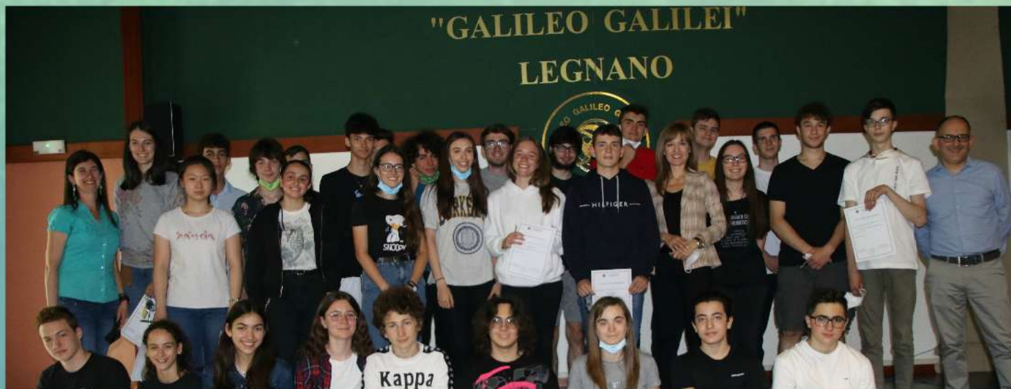
Premiazione Giochi Matematici 2022